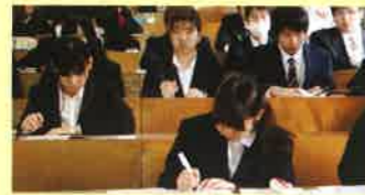
本学では、毎年1・2年次生を対象に「就職ガイダンス」を行い、全学生一人ひとりにきめ細かな指導・相談を行っています。

就職希望者(115名) 就職決定者(114名) ※文部科学省平成26年度学校基本調査大学卒業生就職率全国平均67.3%