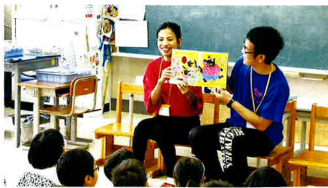
小学校絵本読み聞かせ

また、日本の伝統文化、日本人の生活習慣を学ぶために、「体験型学習」があります。日本人のものの見方、考え方を体験する楽しいひとときです。