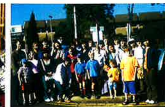
オーストラリア クイーンズランド州 トゥーンバ市