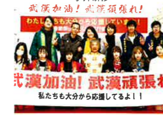
武漢応援チャリティー