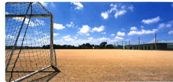
大山グラウンド ※大山グラウンドは本校南西 約5.5kmの位置にあります。