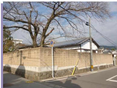
帆足万里生誕の地