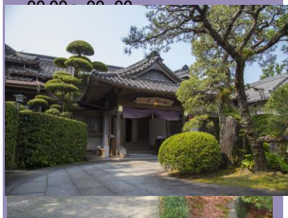
国重要文化財 的山荘

二階堂の麦焼酎を飲んだことがありますか？帆足万里生誕の地、瀧廉太郎父生家跡の付近に社長の豪邸があります