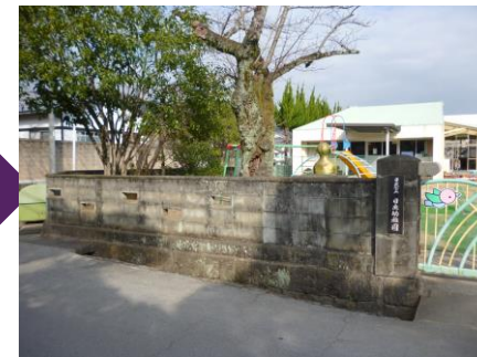
瀧廉太郎 父生家跡

瀧廉太郎の祖父は日出藩の家老職に就いていた。同じ家老で身分が同じなので、帆足万里生誕の地の隣になる。