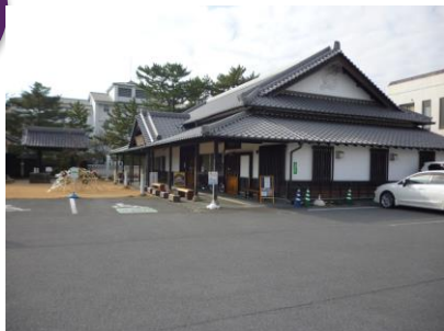
二の丸館 観光協会